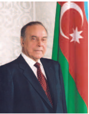
Doğma, canım-varlığım qədar sevdiyim Azərbaycanımın mənim qibləgahımdır